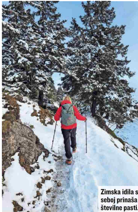
Zimska idila s seboj prinaša številne pasti.